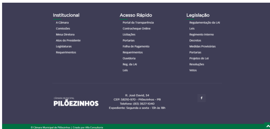
Figura 6 - Rodapé

No rodapé é disponibilizado o mapa do site , com todos os menus, acessos e seus respectivos links. Além disso, no rodapé também é disponibilizado a logomarca do ente, informações de localização e contato.