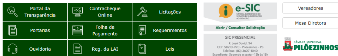
Figura 5 - Acesso rápido