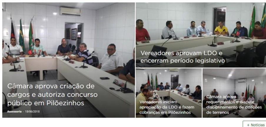
Figura 4 - Módulo de notícias mais recentes

O módulo de notícias é onde ficam disponibilizadas as notícias mais recentes postadas no site. As notícias postadas se referem a atos da gestão do ente ou divulgação de prestação de algum serviço.